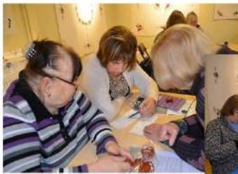
Pamokė taisyklingai išmegzti akis, skaityti šemą ir pagal duotą raštą įmegzti karoliukus.